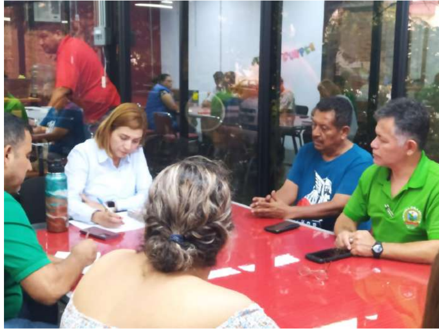
El SUTSEM continúa firmando convenios de colaboración mutua en beneficio de los trabajadores.