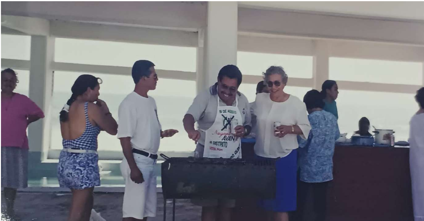
Durante mucho tiempo los trabajadores disfrutaron de las bellezas de Barranquitas, hoy por hoy destruido por los caprichos del gobernador.