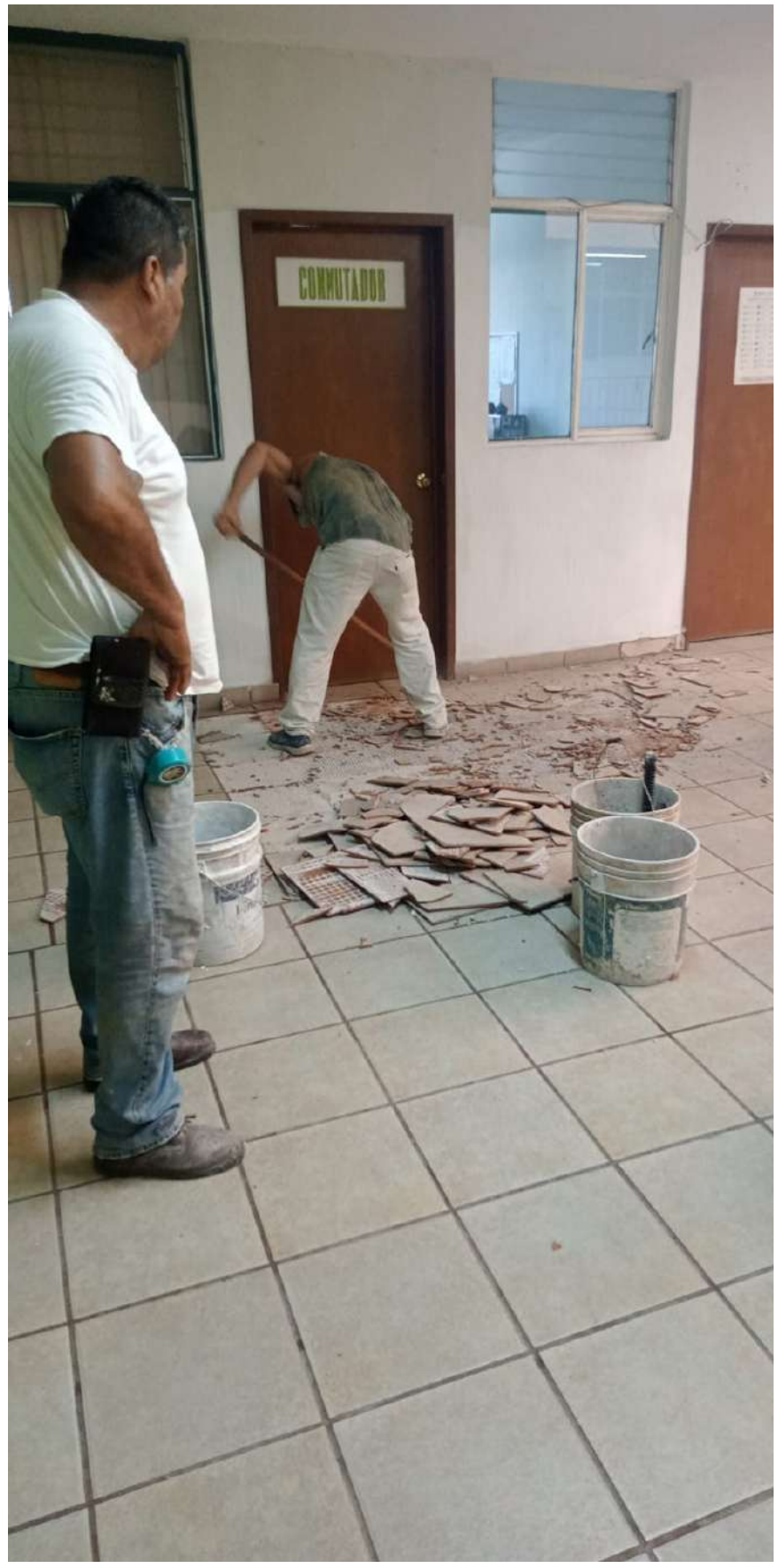
El edificio sindical del SUTSEM recibe atención e inversión en la reparación de daños que se regeneran