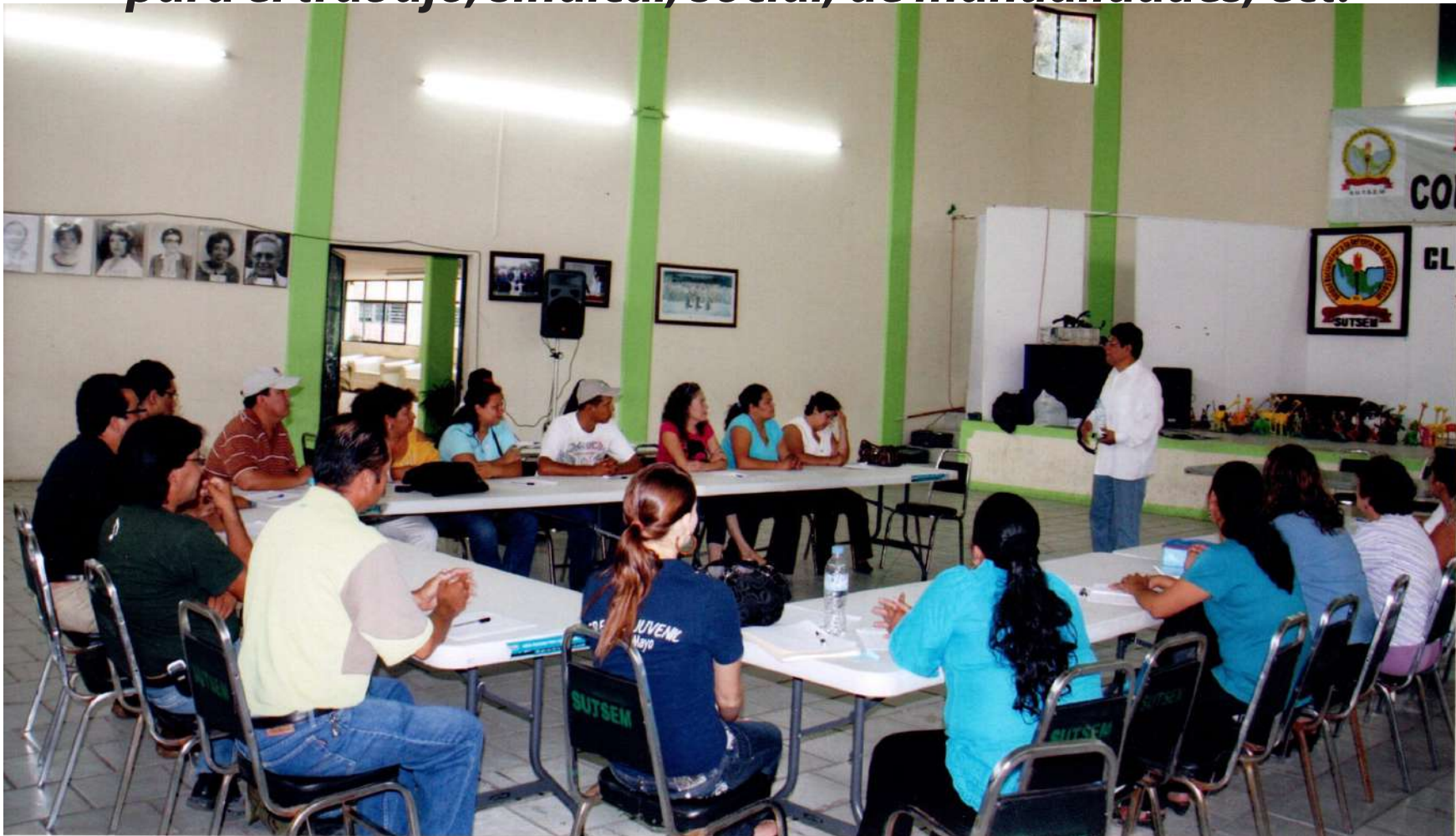
Trabajadoras y trabajadores miembros del SUTSEM. ¡Cuando lucían!

Para los trabajadores del SUTSEM siempre había capacitación para el trabajo, sindical, social, de manualidades, ect.