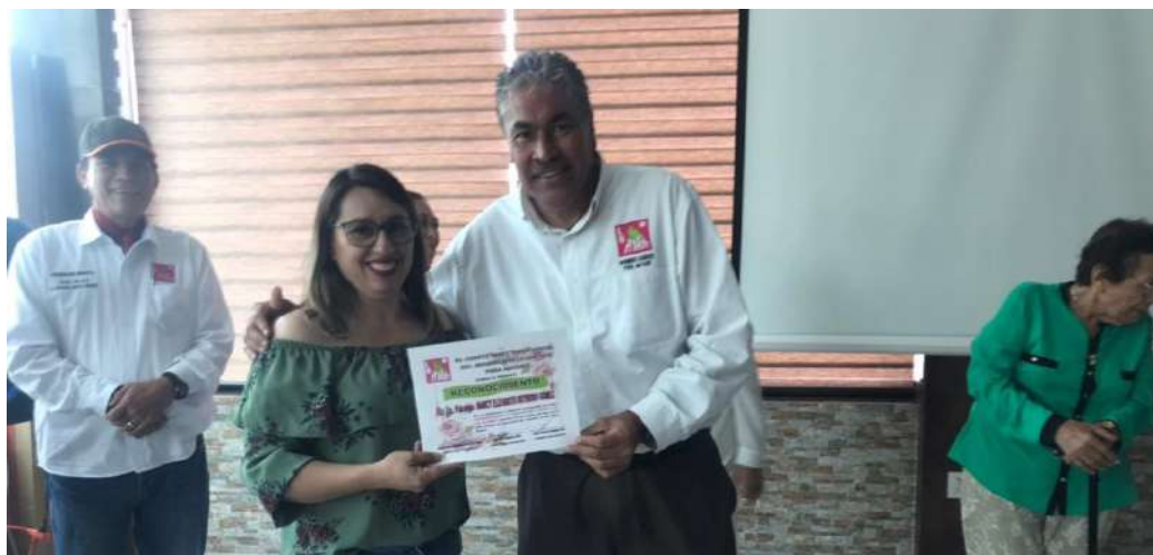
Se entregaron reconocimientos a los participantes.