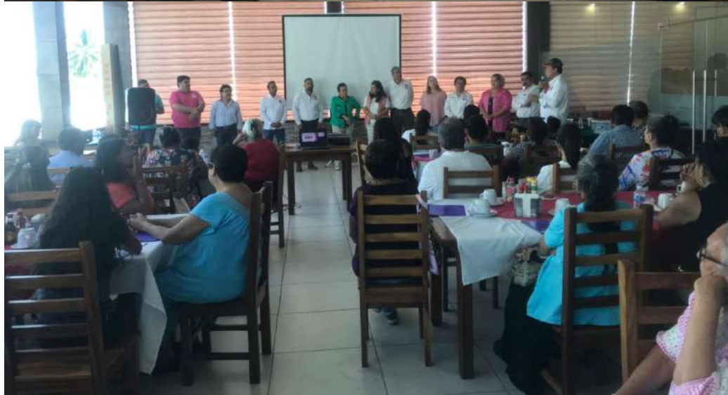
Como primer punto se dieron a conocer las personalizadas que asistieron