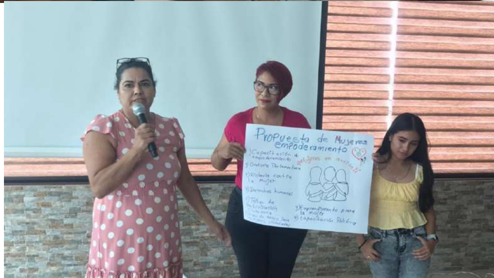
Los asistentes se organizaron en grupos de trabajo y dieron a conocer sus ideas en carteles para su evaluación.