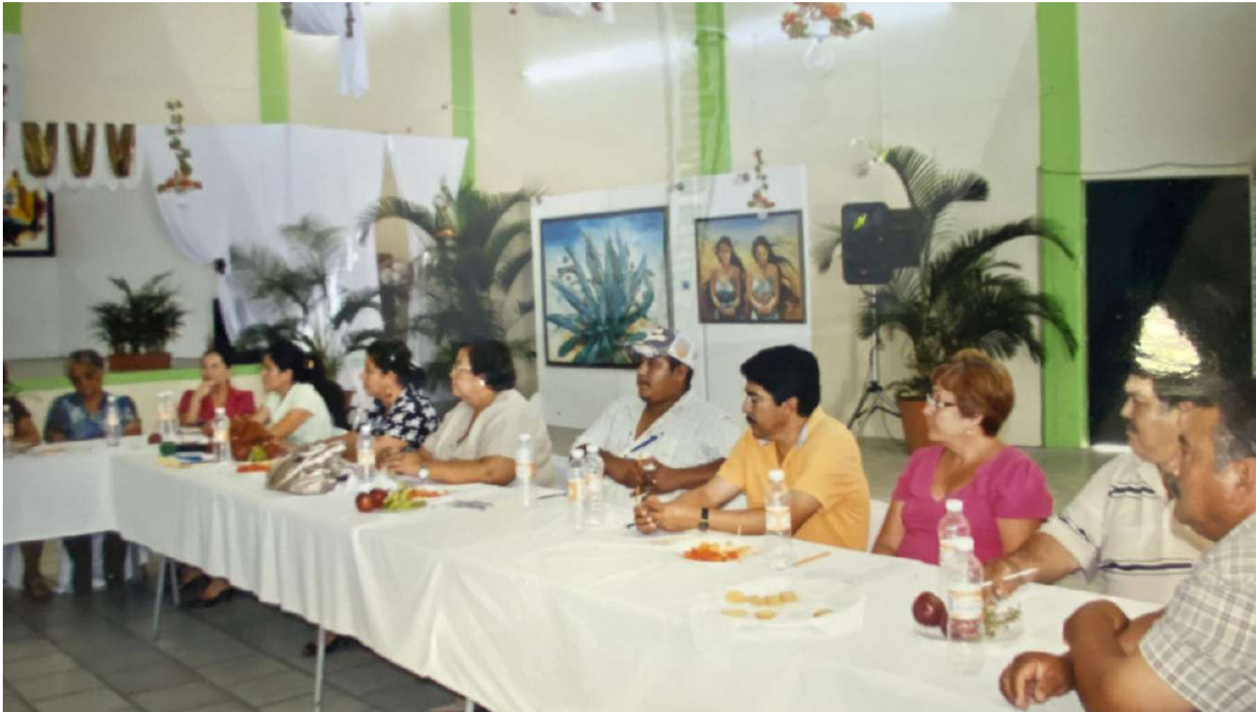
Los SUTSEMistas siempre han recibido Capacitación Sindical preparándolos para enfrentar las investidas que se han recibido de los gobiernos injustos.